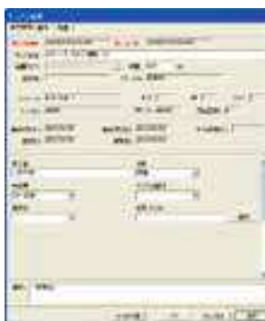
サンプル情報画面