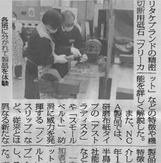
各班に分かれて製品を体験

2024国際ウエルディングショー(J-IWS)出展テーマは「溶接のワンストップ提案」で、溶接機から溶接材料、当社の本業であるガス、ヒューム測定からマスクフィットテストまでのすべてを、任せてほしいというコンセプトだ。