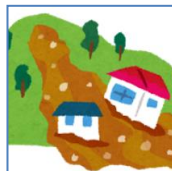
大雨による洪水 土砂崩れ